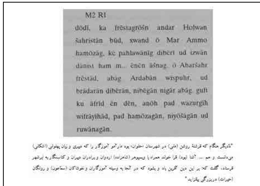
► تصویر ۲. قطعه‌ی مانوی (سرکاراتی، ۱۳۸۴: ۵۵).

خاراکی از این منطقه به‌عنوان «خالا» یاد می‌کند: از این‌جا تا «خالونیتس» ۹ که دارای پنج روستا با تعدادی ایستگاه است بیست‌ویک سوخونی است و شهر «خالا» که با «آپولونیاتیس» ۱۰ پانزده سوخونی فاصله دارد و یک شهر یونانی به‌شمار می‌رود نیز در همین اقلیم واقع شده است. پس از «خالا» به فاصله‌ی پنج سوخونی، رشته‌کوه‌هایی وجود دارد که به «زاگرس» ۱۱ معروف است و منطقه‌ی میان «خالونیتس» و «مدیا» ۱۲ (ماد) را تشکیل می‌دهد و پس از آن منطقه‌ی «کارینا» شروع می‌شود (خاراکی، ۱۳۹۰: ۱۶).