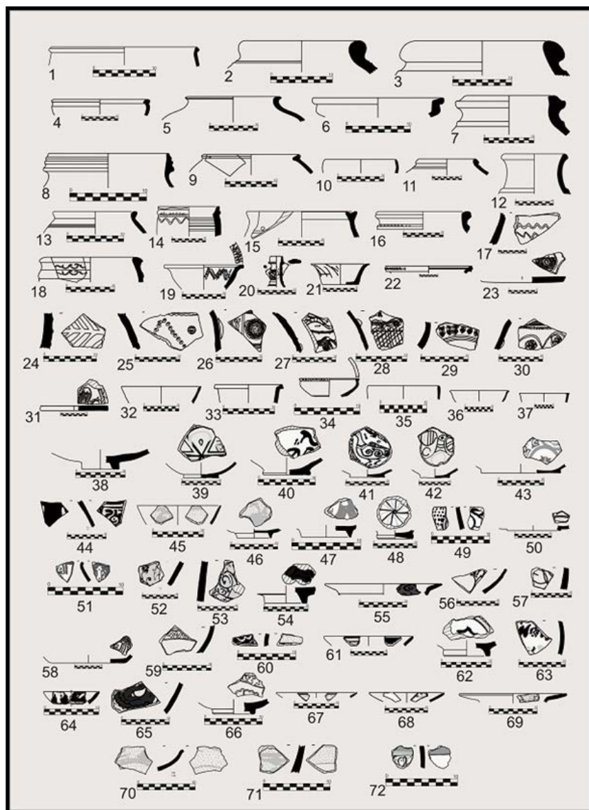
► تصویر ۴. طرح نمونه‌های سفالین محوطه‌ی مالین (نگارندگان، ۱۳۹۴).

نمونه‌های سفالین محوطه‌ی مالین که مهم‌ترین مدارک جهت گاه‌نگاری این محوطه به‌شمار می‌آیند، با نمونه‌ها و ظروف سفالین یافت شده از محوطه‌های حفاری (در درجه‌ی اول) و بررسی‌شده (در درجه‌ی دوم)، مورد مقایسه قرار گرفتند. نتایج حاصل از مطالعات نمونه‌ها و مقایسات انجام‌شده نشان می‌دهد که سفالینه‌های این محوطه در دو دوره‌ی تاریخی (اشکانی و ساسانی) و اسلامی (سده‌های ۳ تا ۱۰ ه.ق.) قابل تاریخ‌گذاری هستند. در این راستا، می‌توان اظهار نظر نمود که هر چند، انتساب برخی قطعات به دوره‌ی معین (اشکانی و یا ساسانی) ناممکن به‌نظر می‌رسد؛ اما هیچ‌یک از نمونه‌های سفالین محوطه‌ی مالین به پیش از دوره‌ی اشکانی تعلق ندارند. هم‌چنین، نمونه‌ای را که