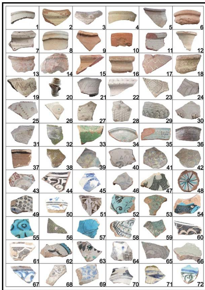
تصویر ۳. عکس نمونه‌های سفالین محوطه‌ی مالین.