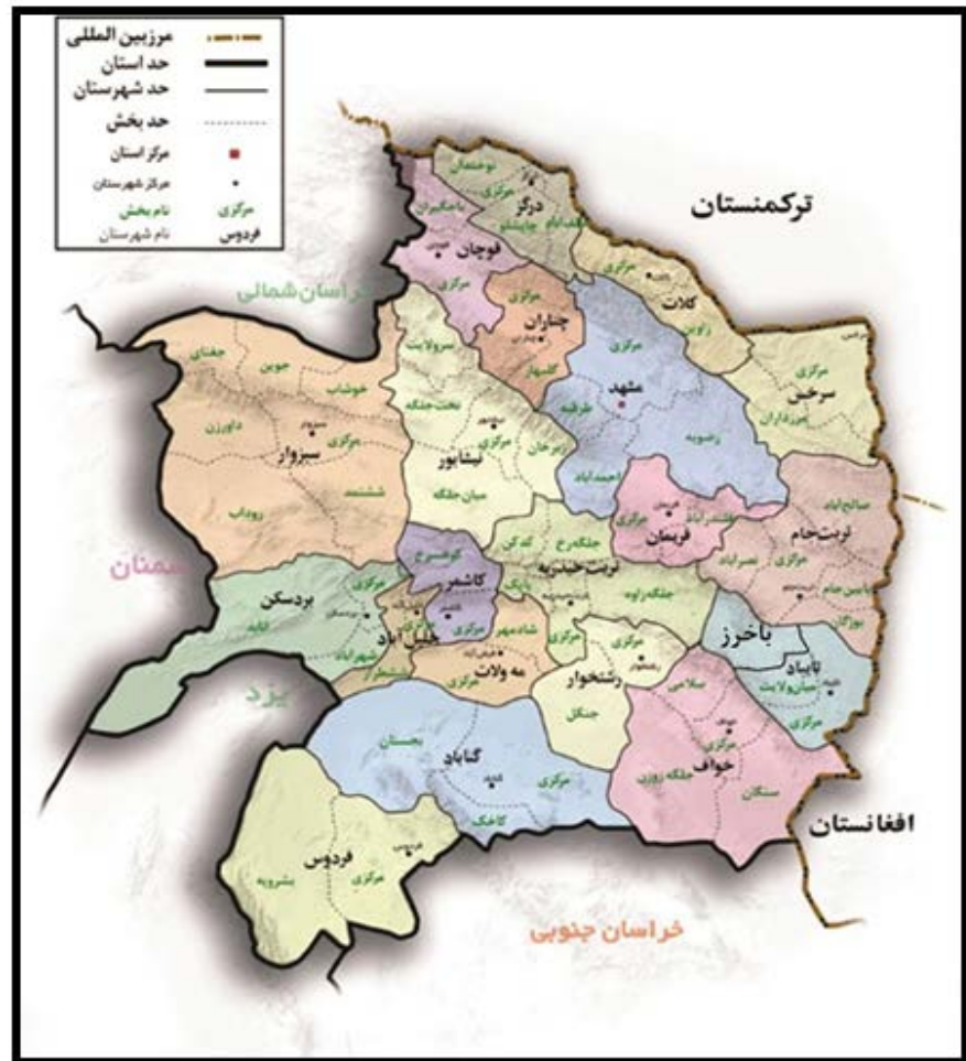
► تصویر ۱. نقشه‌ی استان خراسان رضوی و موقعیت شهرستان باخرز (استانداری خراسان رضوی).

انجام گرفت. در این روش، الگوی طبقه‌بندی شده از آن جهت برگزیده شد که نمونه‌های هر بخش به صورت مجزا و مستقل از یکدیگر جمع‌آوری شده و در آغاز امر، به منزله‌ی نمونه‌های جداگانه مورد مطالعه قرار گیرند. و الگوی روشمند نیز با هدف گردآوری نمونه‌های شاخص با بهره‌گیری از یک قاعده‌ی آماری در بلوک‌های معین و واحدهای مشخص مورد استفاده قرار گرفت. به عبارت دیگر، به جای آن که عمل گردآوری شاخص‌ها به صورت دل‌خواهی از کل محوطه‌ی مالین انجام گیرد، با استفاده از یک روش آماری، درصدی از کل محوطه مدنظر قرار گرفته و عمل گردآوری نمونه‌های شاخص فقط در آن بخش‌ها و به نمایندگی از کل مجموعه، انجام پذیرفت. محدود شدن فضای نمونه‌برداری به بلوک‌های معین و واحدهای مشخص، موجب شد تا نمونه‌برداران به دلیل تسلط و اشرافی که بر فضای مورد نظر برای نمونه‌برداری پیدا می‌کردند، وظایف خود را با دقت و حوصله‌ی بیشتری به انجام برسانند؛ علاوه بر آن، گردآوری روشمند و طبقه‌بندی شده‌ی شاخص‌ها، نیاز اطلاعاتی این پژوهش را برآورده می‌کرد، که موجب می‌شد تا قسمت قابل توجهی از سطوح هر بخش نیز دست‌نخورده باقی بماند. ماحصل این اقدام، ایجاد ۱۷۵ شبکه از مربعات بود که براساس راهبردهای پژوهش، از سی مربع، معادل ۱۷/۱۴ درصد محوطه، نمونه‌برداری انجام گرفت.