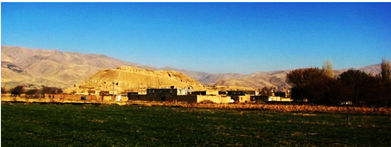
▲ تصویر ۳. روستای خاکریز که در کنار محوطه‌ی باستانی خاکریز مربوط به دوره‌های پیش‌ازتاریخ و تاریخی شکل‌گرفته است (وفایی، ۱۳۹۱: ۱۱۷).

در مورد چشم‌اندازهای شکل‌گرفته در دشت اسدآباد، بایستی گفت آن‌چه بیشتر از هر چیزی در این دشت جلب‌توجه می‌کند، قرار گرفتن روستاهای امروزی در کنار محوطه‌های باستانی است که عمدتاً مربوط به دوره‌های پیش‌ازتاریخ می‌باشند، در کنار این محوطه‌های باستانی قرار گرفته‌اند (تصویر ۳).