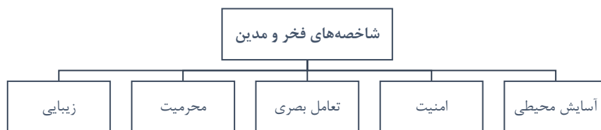
شکل ۲. شاخصه‌های فخر و مدین (نگارندگان، ۱۳۹۷).