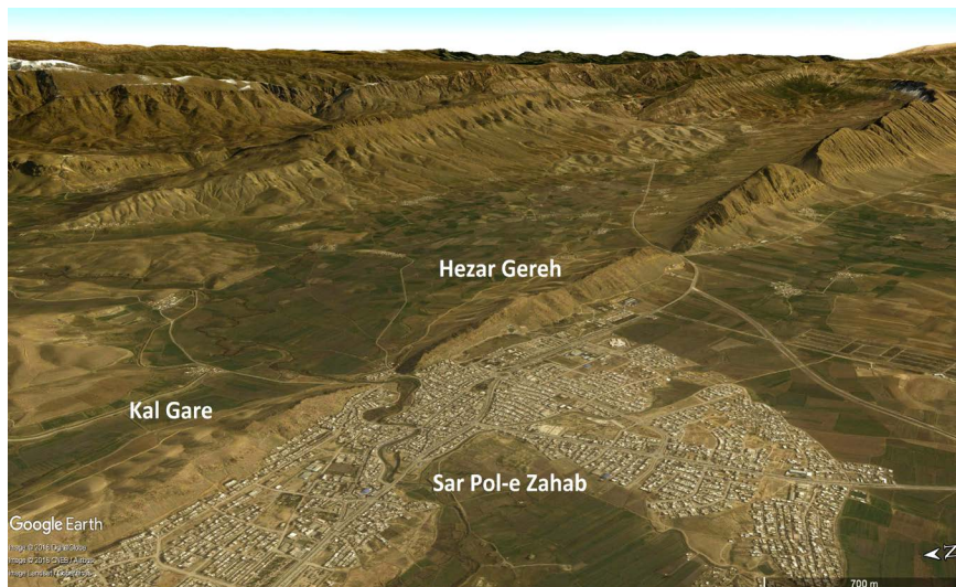
تصویر ۲. تصویر ماهواره‌ای از شهر سرپل ذهاب و کوه هزارگره (باتیر)، (Google Earth).