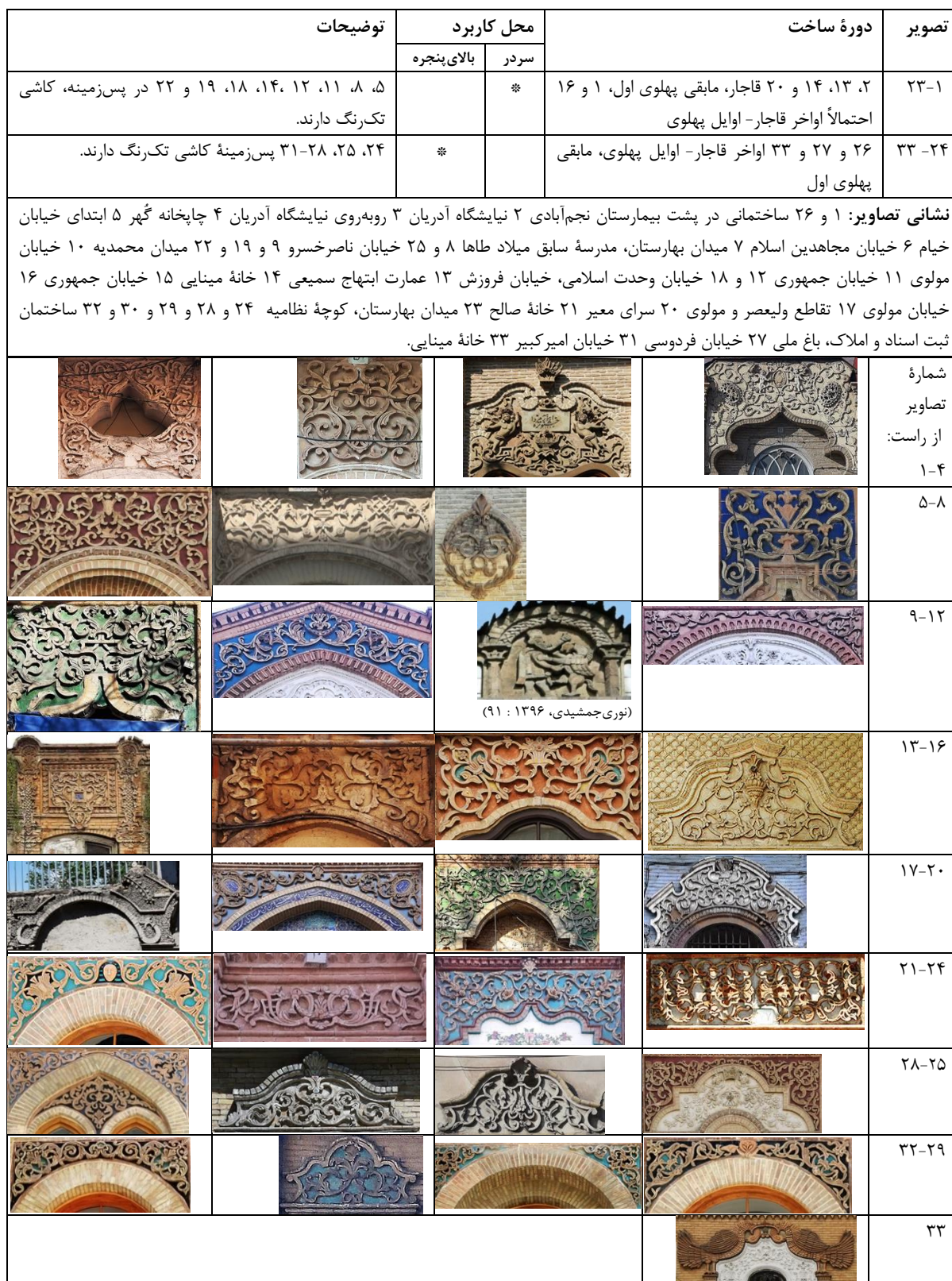
جدول ۸. سردر و بالای پنجره‌های منفرد (یگانه) در بناهای قاجار و پهلوی تهران (نگارندگان، ۱۳۹۹).