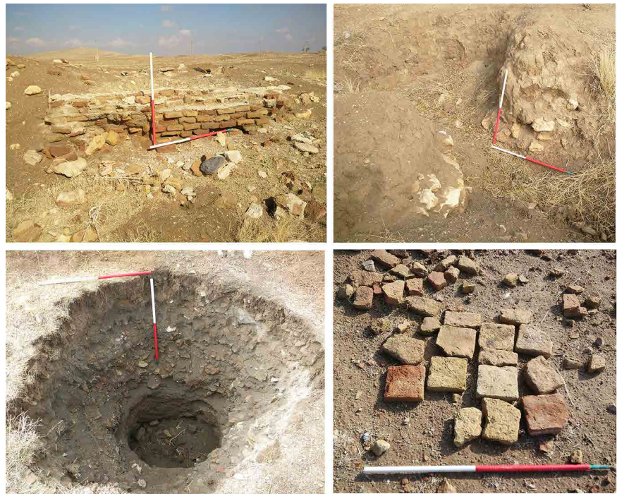
Fig. 4. The Distribution of architectural works (stone and brick) in the western and northeastern part of the Bozanjerd Site (Rezaei, 2020).

شواهدی مبنی بر بهره‌گیری از آن در بنای مذهبی بوده است. نمونه‌های مشابهی از این نوع کاشی‌ها به لحاظ نقش‌مایه و فن ساخت در مراکزی هم‌چون: کاشان (واتسون، ۱۳۹۰)، ری (Treptow, 2007)، آوه (لشکری و همکاران، ۱۳۹۳: ۴۶-۴۴)، ذلف‌آباد (نعمتی و همکاران، ۱۳۹۱: ۱۳۵)، سلطانیه (مهیار و همکاران، ۱۳۶۵: ۲۴۷) و تخت‌سلیمان (طاووسی و همکاران، ۱۳۹۲: ۶۵-۵۷) تولید و یا شناسایی شده‌اند (جدول ۲: شماره ۶-۱). از کاشی منقوش لعابی نیز چندین قطعه با تزئینات اسلیمی و هندسی در زمینه فیروزه‌ای و سفید، در اشکال چهارلنگه و چندپر به دست آمد (جدول ۲: شماره ۹-۷). قطعاتی نیز از کاشی لاجوردینه به صورت تک‌رنگ ساده در اشکال مختلف چلیپایی (چهارلنگه)، سیلی، چهارضلعی و شش‌ضلعی شناسایی شد (جدول ۲: شماره ۱۰ و ۱۱).