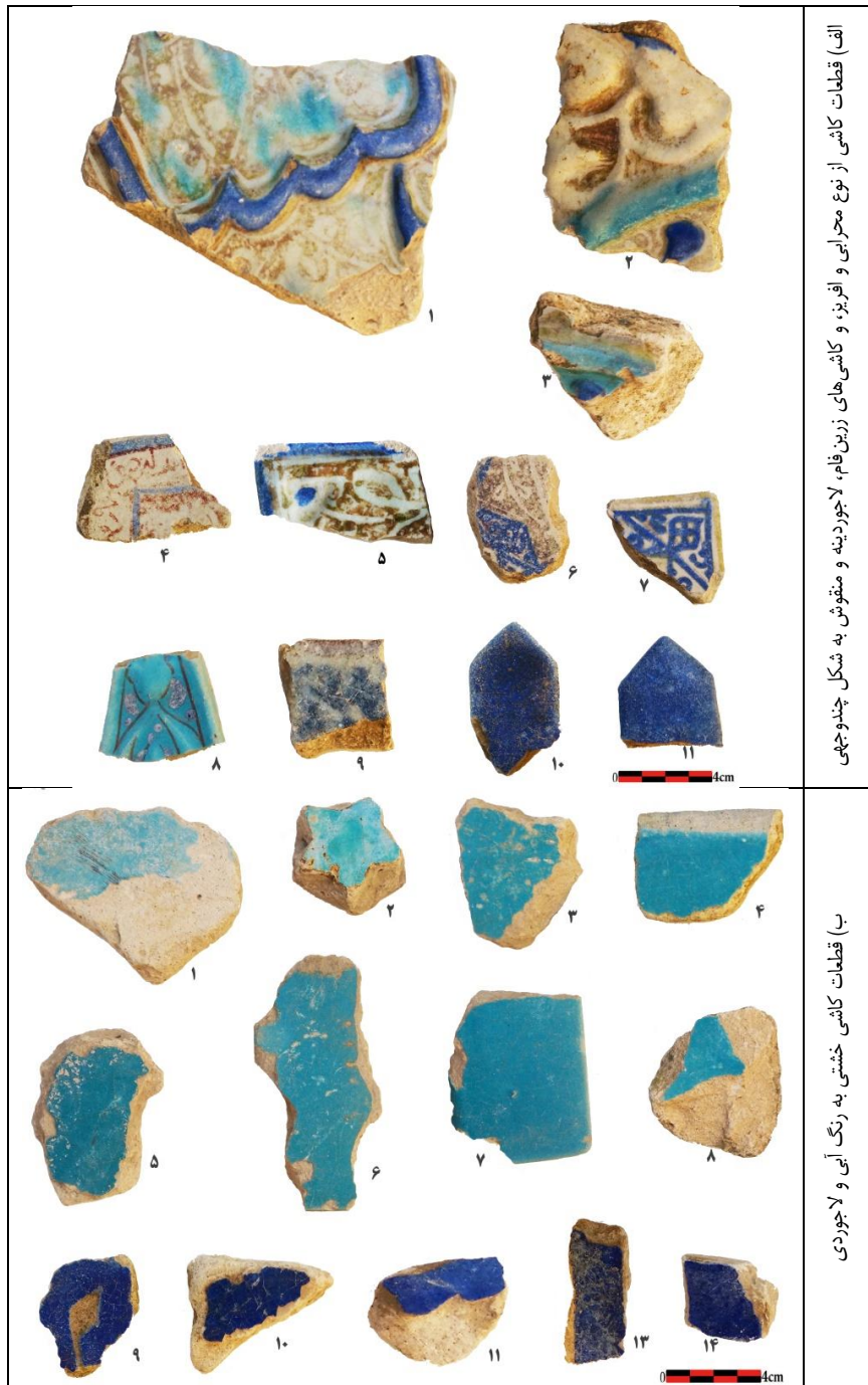
جدول ۲. انواع کاشی‌های به‌دست آمده از محوطه بوزنجر (رضائی، ۱۳۹۹). Tab. 2. All kinds of tiles obtained from the Bozanjerd Site (Rezaei, 2020).

درمیان کاشی‌های خشتی تک‌رنگ فیروزه‌ای و لاجوردی به‌دست آمده از محوطه، اشکال هشت‌ضلعی، شش‌ضلعی و ستاره‌ای شکل به‌روشنی قابل تشخیص است (جدول ۲: ب). علاوه بر آن شکل کاشی نبشی در بین این دسته از آثار که در لبه‌ها و کنج‌های بنا همراه با سایر اشکال کاربرد داشته، دیده می‌شود (جدول ۲: ب، شماره ۸-۵). قطعات کاشی‌های خشتی برجای مانده از محوطه از نوع کاشی‌های قرن هفتم و هشتم هجری قمری هستند که نمونه‌های قابل مقایسه با آن را