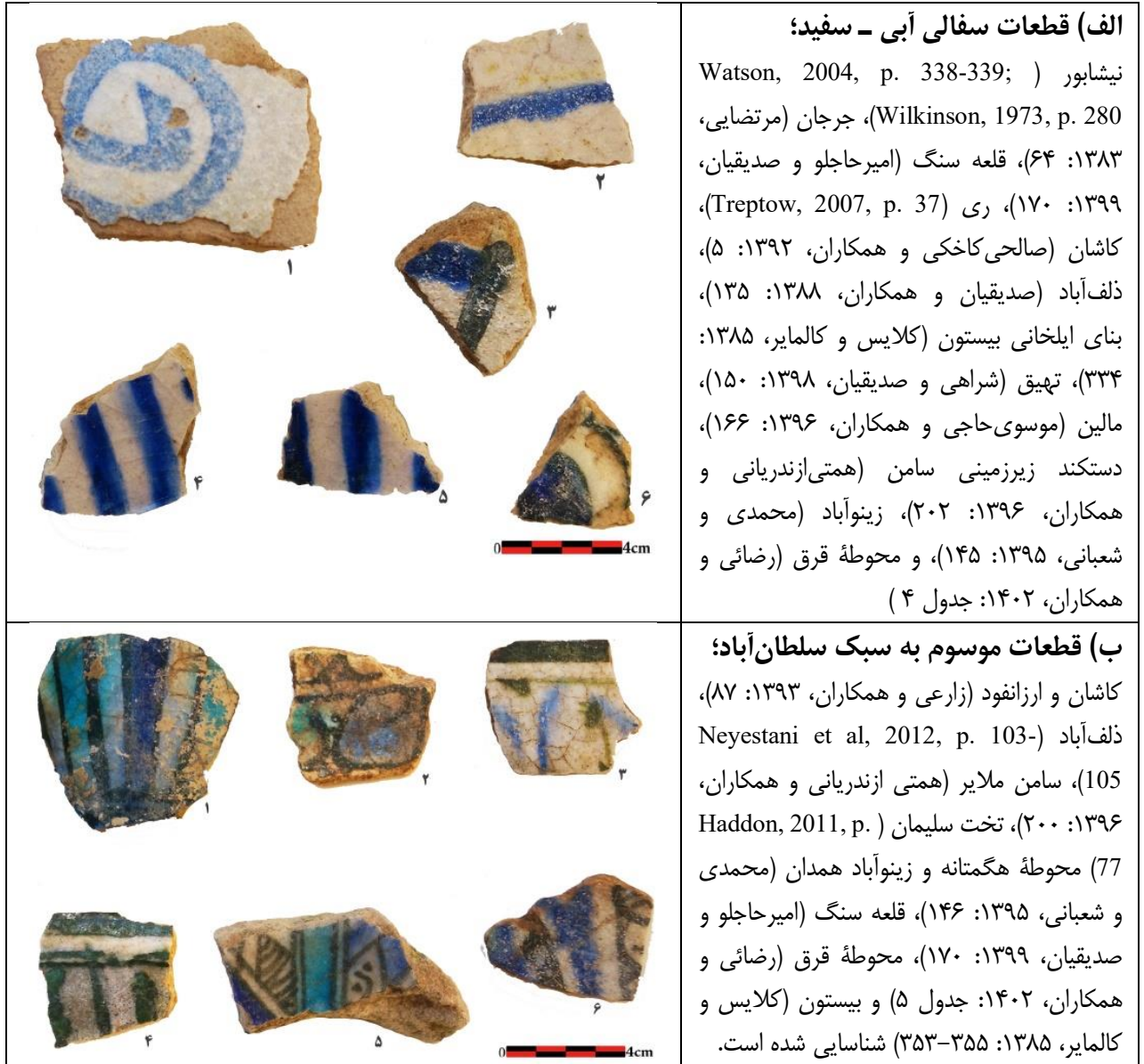
جدول ۴. قطعات سفالی آبی-سفید و سبک سلطان‌آباد محوطه بوزنجرده (رضائی، ۱۳۹۹). Tab. 4. Blue-white pottery pieces and Sultan Abad style of the Bozanjerd Site (Rezaei, 2020).

از محوطه امروزی بزینه‌جرد کشف شد که درحال حاضر در موزه ایران باستان نگه‌داری می‌شود. این مجموعه برای نخستین بار در جلد ششم کتاب سیری در هنر ایران، نگارش «پوپ» و «اکرم» (۱۳۸۷ ج: ۶ و ۱۳) - لوح‌های ۱۳۱۶، ۱۳۳۲، ۱۳۳۴، ۱۳۴۱، ۱۳۴۲ الف- منتشر شد. بعدها «طاهر رضازاده» (۱۳۹۶) در مقاله‌ای به مطالعه ویژگی‌های هنری، سبک‌شناسی نقوش و شناسایی مکتب فلزکاری این گنجینه پرداخته است؛ از جمله اشیاء شاخص این مجموعه می‌توان به دخل برنجی کنده‌کاری شده و نقره‌کوب، شمعدان برنجی نقره‌کوب با بدنه‌ی نه‌وجهی (تصویر ۵: الف و ب)، تشت برنجی کنده‌کاری شده و مرصع به نقره، سینی برنجی کنده‌کاری