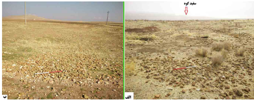
Fig. 3. The Distribution of architectural works (stone and brick) in the western and northeastern part of the Bozanjerd Site (Rezaei, 2020).

► تصویر ۴. بقایای معماری (سنگی و آجری) که در پی کاوش‌های غیرمجاز نمایان شده (رضائی، ۱۳۹۹).