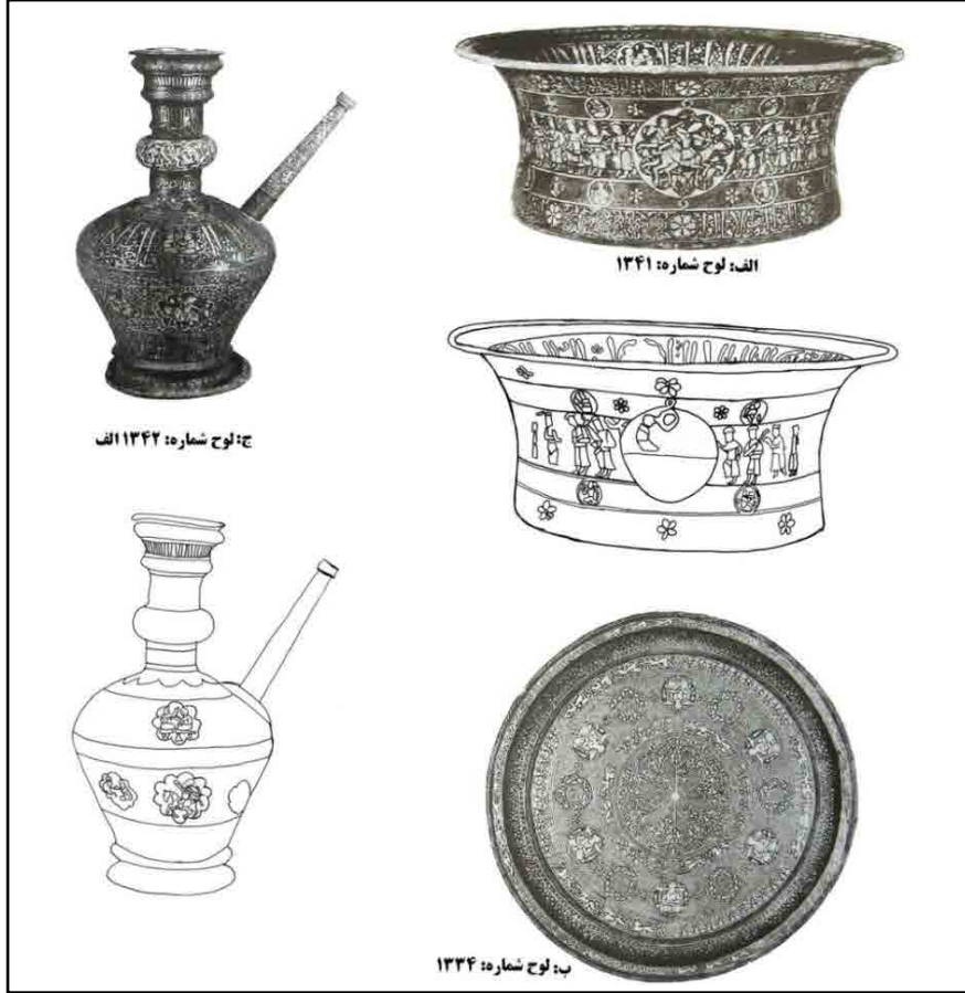
تصویر ۶. تشت برنجی، آفتابه نقره‌ای و سینی برنجی مرصع به طلا و نقره گنجینه بوزنجر (پوپ و اکرم، ۱۳۸۷ ج ۱۳: لوح‌های ۱۳۳۴، ۱۳۴۱، ۱۳۴۲ الف). ◀