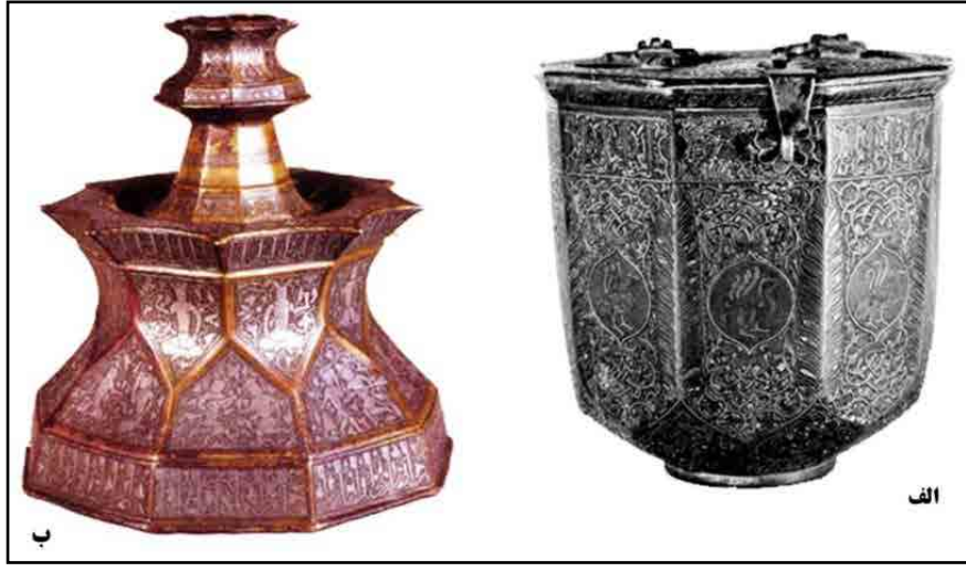
تصویر ۵. دخل مفرغی و شمعدان برنجی نقره‌کوب گنجینه بوزنجر (موزه ملی ایران باستان، شماره ۳۵۲۶ و ۳۵۲۸). ◀